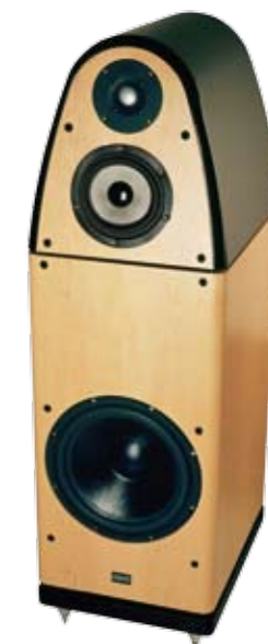
Kai kurie gamintojai nurodo savo kolonėlių atkuriamą dažnių juostą, priklausomai nuo leistino nelineiškumo – PVZ., „REVOLVER CYGNIS“ kolonėlių apraše žadamas 30 Hz–30 kHz diapazonas, jei nelineiškumas +/- 6 dB, ir 45–22 kHz diapazonas, jeigu nelineiškumas apribotas +/- 3 dB.

Tačiau per vadinamąją „antrinę signalinę sistemą“ gali atsitikti ir taip, kad emocijas generuoja ne realus garsinis įvykis, bet tikrų įvykių ir su jais