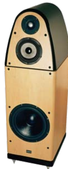
Kai kurie gamintojai nurodo savo kolonėlių atkuriamą dažnių juostą, priklausomai nuo leistino nelineiškumo – PVZ., „REVOLVER CYGNIS“ kolonėlių apraše žadamas 30 Hz–30 kHz diapazonas, jei nelineiškumas +/- 6 dB, ir 45–22 kHz diapazonas, jeigu nelineiškumas apribotas +/- 3 dB.

Tačiau per vadinamąją „antrinę signalinę sistemą“ gali atsitikti ir taip, kad emocijas generuoja ne realus garsinis įvykis, bet tikrų įvykių ir su jais