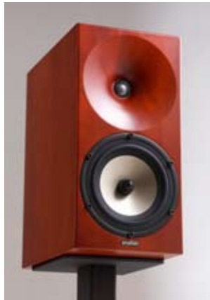
SUOMIŲ BENDROVĖS „AMPHYON“ KOLONĖLĖS NĖRA ITIN JAUTRIOS, BET PUIKIAI SUVALDOMOS NET NELABAI GALINGAIS STIPRINTUVAIS, NES JŲ VARŽA BEVEIK NESIKEIČIA KINTANT DAŽNIŲ LYGIUI.

kolonėlės. Su jautriu susijęs dar vienas svarbus parametras – dinaminis diapazonas, nurodantis decibelų skirtumą tarp tyliausio garso, kurį sugeba sugeneruoti kolonėlės, ir paties stipriausio garso, kurį jos sugeba atkurti, nepasiekdamos kritinio 8 % nelineinio iškraipymo lygio. Maksimalus dinaminis diapazonas, kuriame mūsų smegenys įvertina vibracijas kaip garsą, yra 150 dB, o maksimalus, kurį sugeba atkurti net geriausios akustinės kolonėlės, paprastai nesiekia 110 dB – to jau nepakanka norint atkurti simfoninio orkestro dinaminį diapazoną, kuris siekia 120 dB. Roko koncertuose būna ir daugiau garso. Deja, daugumos kolonėlių dinaminis diapazonas vos 80–90 dB, o tai reiškia, kad apie muzikinio garso tikrovę galima pamiršti – jos arba nepada- ro reikiamo įspūdžio per signalo pikus, arba išvis nereaguoja į signalą tyliausiose kūrinių vietose ar į silpniausias garso sudedamąsias dalis. Turint tokias kolonėles, galima klausyti muzikos garsai, ausies jautrumas atitinkamai prisitaikys ir sumažės, galima klausyti ir tyliai, ausies jautrumas padidės, bet nėra mechanizmo, kuris leistų atkurti suspaustą dinaminį diapazoną (prisiminsime, kad 3 dB reiškia 2 kartus didesnį garso spaudimą) iki tikro garso dinamikos lygio. Siauras dinaminis diapazonas labai vargina. Platus dinaminis diapazonas tiesiogiai susijęs su atkuriamos muzikos skaidrumu ir išraiškumu, klausyti net labai sudėtingą muziką tampa malonu. Bet ir šio parametro beveik niekas niekada nenurodo.